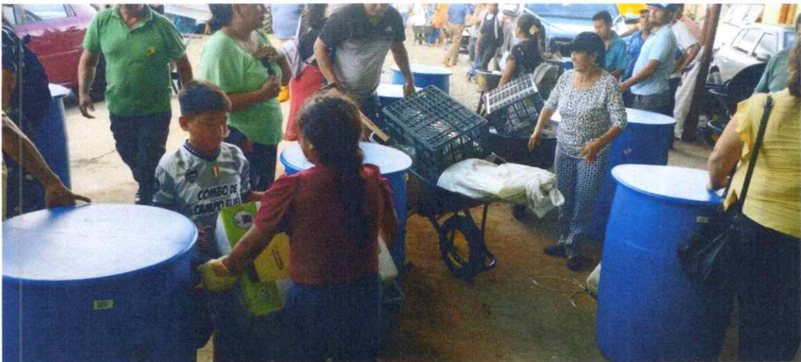
Entrega de las secadoras